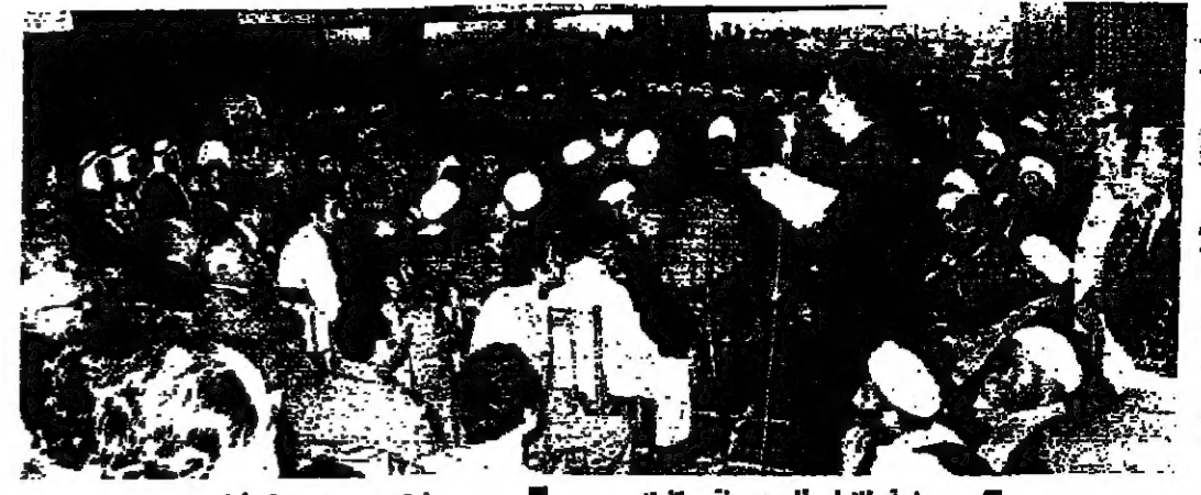
مسلمة الامام الصدر يلقى كلمته